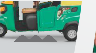
అత్యధిక గ్రౌండ్ క్లియరెన్స్