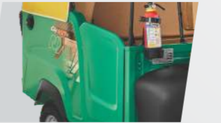
ప్రయాణీకులకు సురక్షితమైన డోర్