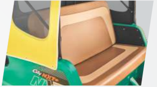
డ్యూయల్ టోన్ సీట్లు