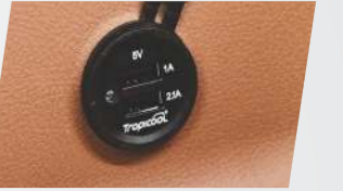
డ్యూయల్ పోర్ట్ USB ఫాస్ట్ ఛార్జర్