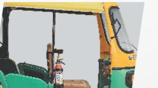
మెరుగైన హెడ్ రూమ్