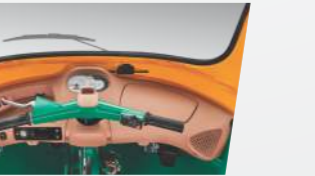
మల్టీ ఇన్ ఫర్ మేటివ్ డిస్ స్ట్రీ