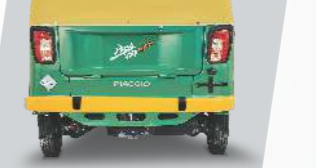
స్టైలిష్ రీడ్ బంపర్