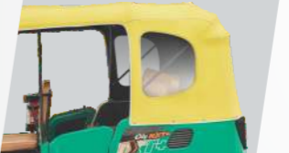
పెద్ద మరియు పారదర్శక విండోతో స్టైలిష్ హెడ్